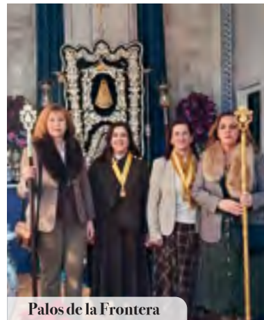
Palos de la Frontera