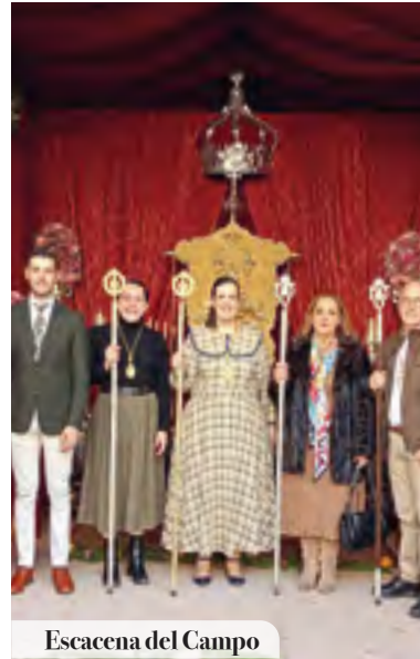
Escacena del Campo