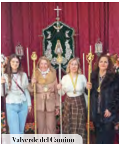
Valverde del Camino