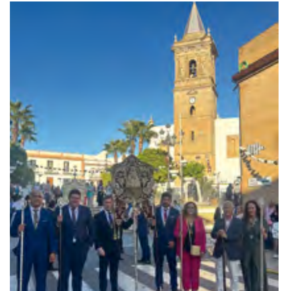
Procesión 450 aniversario V. Carmen.

A lo largo del año, nuestra hermandad ha participado activamente en misas, procesiones y otros actos organizados por hermandades locales y rocieras fuera de nuestro pueblo, mostrando así nuestro compromiso y unión con la comunidad y las tradiciones hermanadas.