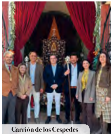
Carrión de los Cespedes