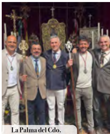
La Palma del Cdo.