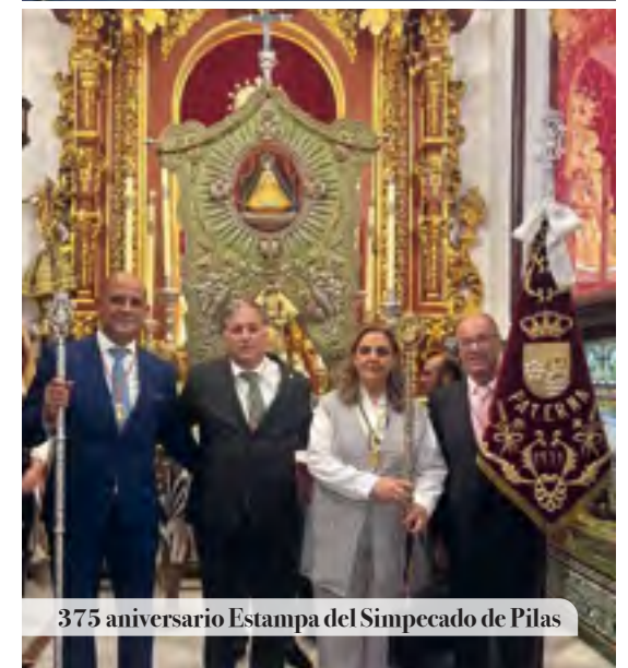
375 aniversario Estampa del Simpeccado de Pilas

Nuestra Hdad. Participó en el V Via Crucis Rociero de la provincia de Huelva . Una quinta edición que ha estado organizada por la Hermandad del Rocío de San Juan del Puerto y marcada de novedades, ya que, por primera vez, el rezo de este Vía Crucis se ha llevado a cabo dentro de la propia aldea, al no poderse llevar a cabo por los caminos debido a la situación en la que se encuentran por las inclemencias meteorológicas.