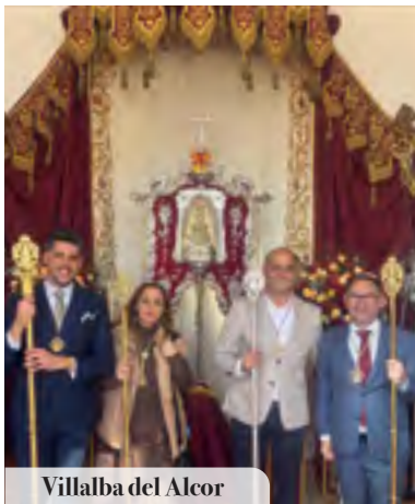
Villalba del Alcor